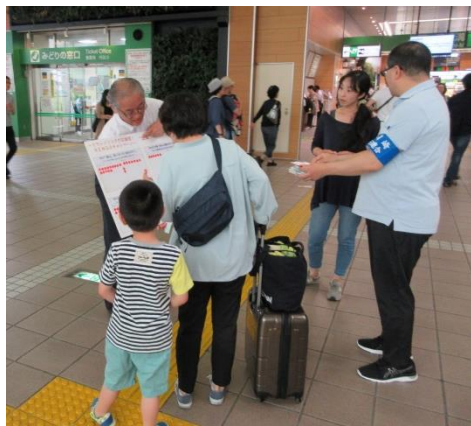
街角アンケートの協力に感謝