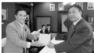
神奈川県知事を表敬訪問

滞在日程としては、日産自動車追浜工場・神奈川県知事・神奈川県議会・ポリテクセンター関東・連合神奈川執行委員会へ訪問され意見交換等を開催した。