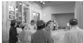
ポリテクセンター関東