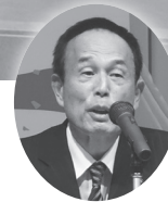
相模原市加山市長