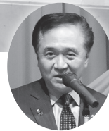
神奈川県黒岩知事