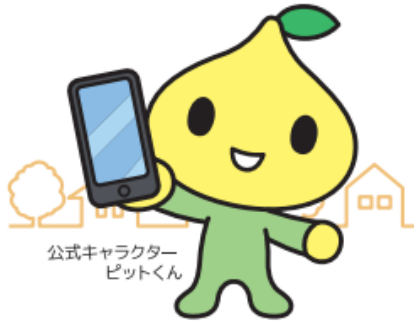
公式キャラクター ピットくん