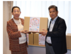
乳児院施設へタオルを寄贈