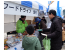
食品を家から持ってきました

神奈川県労働者福祉協議会 〒231-0026 横浜市中区寿町1-4かながわ労働プラザ TEL 045-227-6290 FAX. 045-227-6291