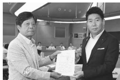
8月27日、川崎市福田市長