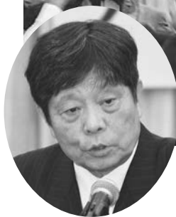
連合神奈川柏木会長