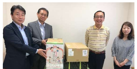
2019年葉山幸保愛児園贈呈風景

食品については『フードバンクかながわ』に全て寄贈し、必要に時に児童施設へ寄贈出来る体制強化に役立てます。